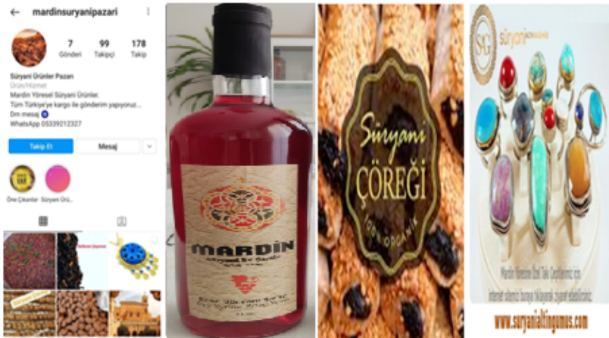
Görsel 5. Mardin’de Süryanî Kimliğiyle İlişkilendirilen Yerel Ürün Örnekleri