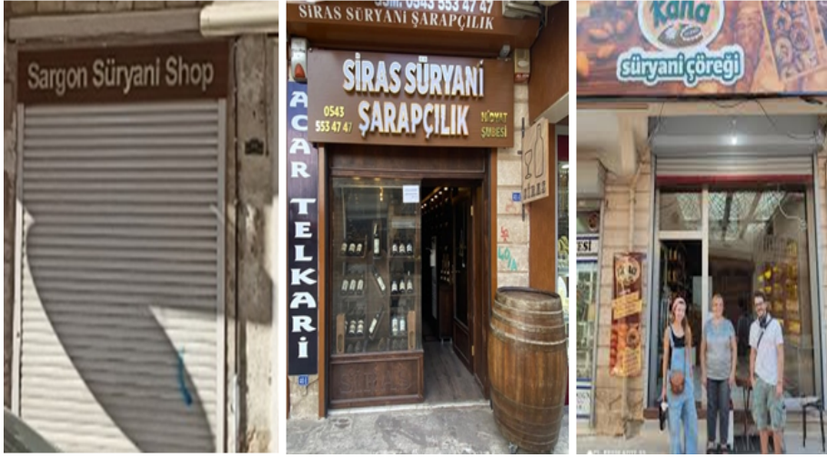
Görsel 4. Mardin’de Süryanî Kimliğiyle İlişkili Yerel Girişimcilik Örnekleri