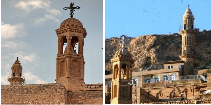
Görsel 3. Mardin’de Kentsel Mekânın Turistikleştirilmesi: “Dinlerin Bir Aradalığı” Söylemi