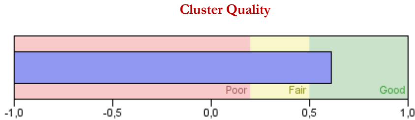
Figure: Two-step cluster algorithm summary

In the research conducted, the Two-Step Cluster algorithm was applied over the five variables mentioned above. As a result of the cluster analysis, it was determined that there were five clusters according to the five variables detected. However, the success and validity of the cluster determined using the Silhouette Index was tested, and it was understood that there was a sufficient level of cluster success in this test.