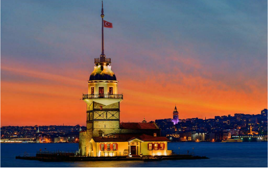
Resim 6. 2020, Kız Kulesi. (Seyyah Defteri, t.y)