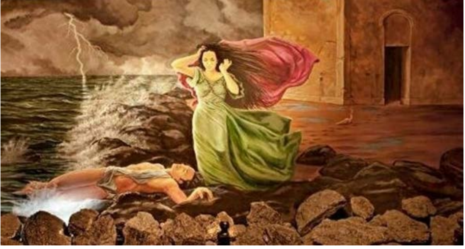
Resim 7. Hero ve Leandros'un Aşk.

Battal Gazi ve Tekfurunun Kızı: İstanbul'u kuşatmak isteyen Battal Gazi, kuşatmadan sonuç alamayınca, Üsküdar'da, Kız Kulesi'nin önündeki kıyıda yedi yıl karargâh kurmuştur, söylentilere göre yedi yıl burada kalmasının ana sebebi, Üsküdar Tekfurunun kızına âşık olmasıdır. Bu durumdan haberdar olan ve korkan Üsküdar Tekfuru, kızını ve hazinelerini kuleye kapatmıştır. Şam seferi sonrasında Üsküdar'a gelen Battal Gazi ve askerleri, kuleye giderek tekfurun kızını ve hazineleri almıştır. Halk arasında söylenen "Atı alan Üsküdar'ı geçti" deyiimi buradan gelmektedir (Resim 8), (Menekay, 2009, s.4).