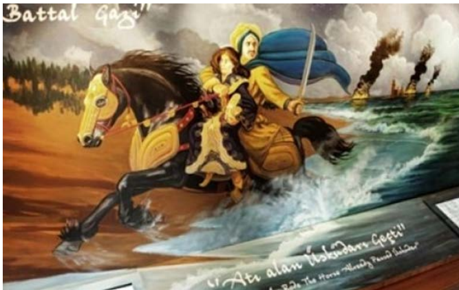
Resim 8. Battal Gazi ve Tekfurunun Kızı (Neoldu, 2015)

Battal Gazi ve Tekfurunun Kızı: İstanbul'u kuşatmak isteyen Battal Gazi, kuşatmadan sonuç alamayınca, Üsküdar'da, Kız Kulesi'nin önündeki kıyıda yedi yıl karargâh kurmuştur, söylentilere göre yedi yıl burada kalmasının ana sebebi, Üsküdar Tekfurunun kızına âşık olmasıdır. Bu durumdan haberdar olan ve korkan Üsküdar Tekfuru, kızını ve hazinelerini kuleye kapatmıştır. Şam seferi sonrasında Üsküdar'a gelen Battal Gazi ve askerleri, kuleye giderek tekfurun kızını ve hazineleri almıştır. Halk arasında söylenen "Atı alan Üsküdar'ı geçti" deyiimi buradan gelmektedir (Resim 8), (Menekay, 2009, s.4).