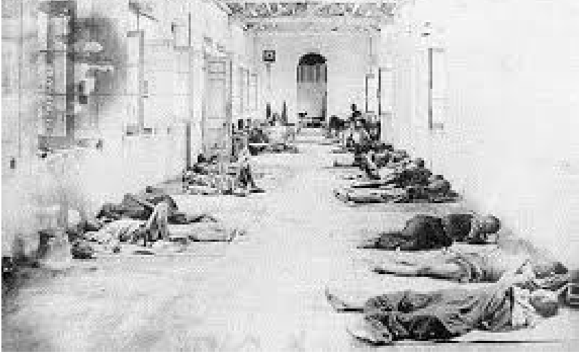
Resim 10. Karantinada Hastalar. (Tarihi Olaylar ve Fotoğraflar, 2018).

Bulaşıcı hastalıklar nedeniyle çeşitli tedbirler alınıp, hastalığa yakalanmış olan insanların tecrit edilmesi eskiden beri görülen bir uygulamadır. Karantina uygulamasının yaygınlaşması ve karantina teşkilâtlarının kurulmasında salgınların büyük etkisi olmuştur. Yüzyıllar boyunca insanlığı panikleten ve endişelendiren veba salgınlarının yerini 19. Yüzyılda kolera salgınları almıştır ve sağlık teşkilâtlarının hızlı bir şekilde kurulmasını hızlandırmıştır, milletlerarası iş birliği ve anlaşmaların yapılmasına da sebep olmuştur. Hindistan'dan çıkarak bütün dünyaya yayılan ve Asya kolerası olarak adlandırılan kolera, Osmanlı İmparatorluğu'nda da etkili olmuştur. 1817, 1829, 1852, 1863, 1881 ve 1899 yıllarındaki salgınlar kitle halinde büyük ölümlere yol açmıştır (Resim 11), (Sarıyıldız, 2001, s.463).