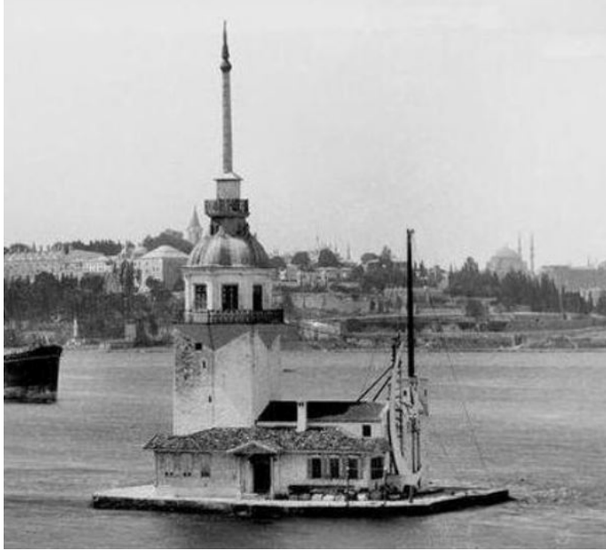
Resim 5. Dilimli Kubbe ve Bayrak direği eklenmiştir. (İstanbul Tarih, 2016)