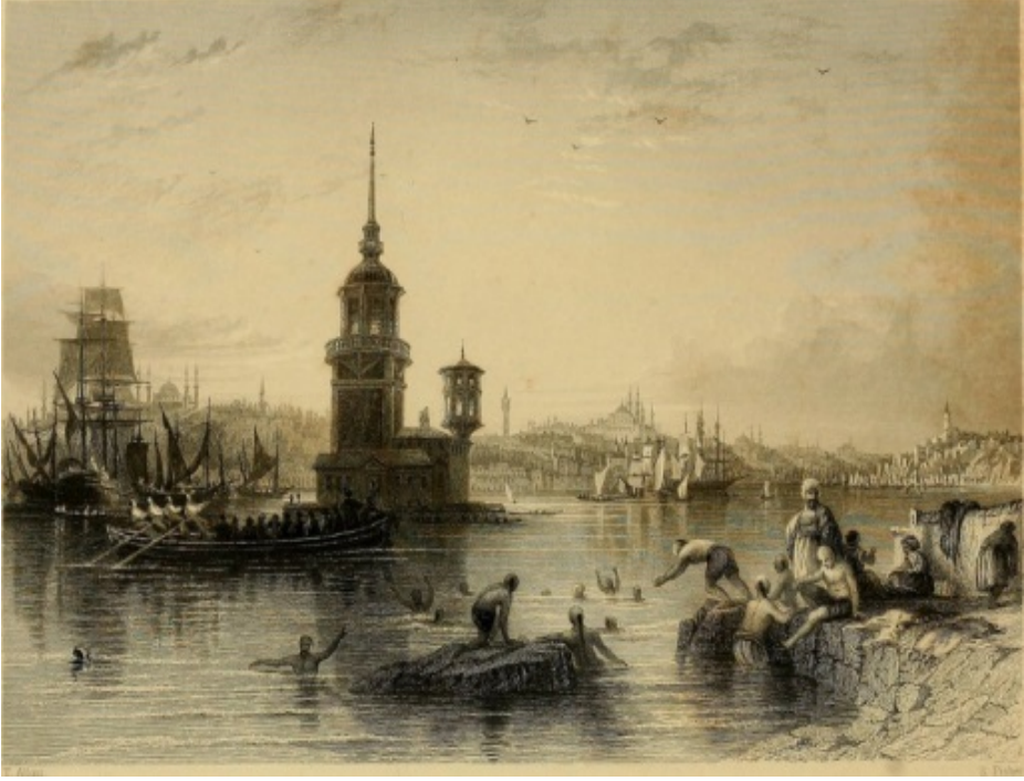
Resim 1. Kız Kulesi.

Fatih Sultan Mehmed İstanbul'u kuşattığında, Bizans İmparatorluğuna yardım etmek üzere Venedik'ten İstanbul'a gelen bir filo kuleyi üs olarak kullanmıştır. İstanbul'un fethinden sonra Fatih Sultan Mehmed, küçük olan Kız Kule'sini yıktırarak taş malzemeden, etrafı mazgallarla çevrili küçük bir kalecik yaptırmış ve toprak yerleştirmiştir (Resim 2), (Aytar, 2013, s.6).