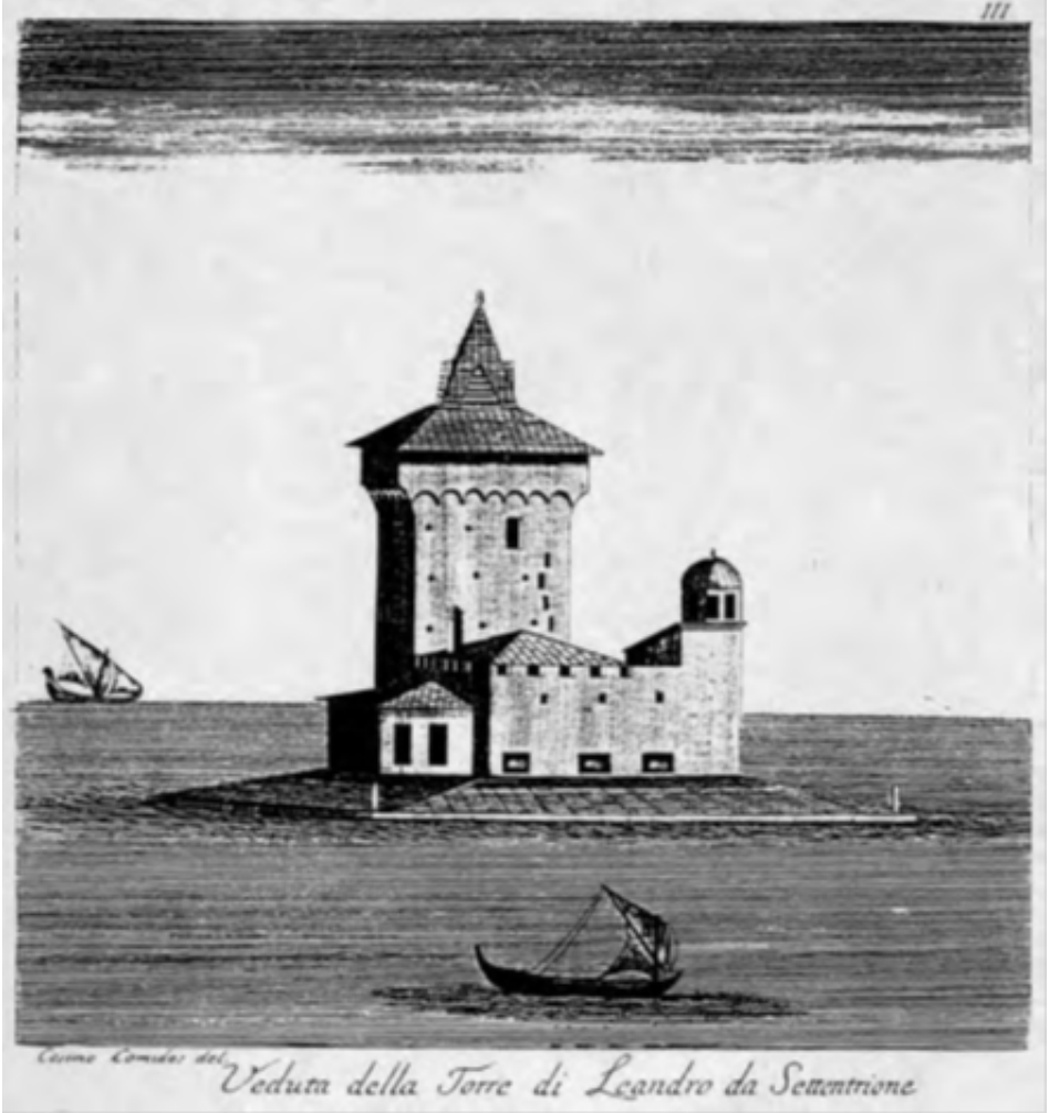
Resim 3. 1760,C.C.De Carbognano, Gravür.

Kız Kulesi, 1959 yılında Askeriye 'ye devredilmiştir. Deniz Kuvvetleri Komutanlığı'na bağlı olarak, boğazın deniz ve hava trafiğinin denetlenmesini sağlayan radar istasyonu olarak kullanılmıştır. 1983 yılından sonra kule Denizcilik İşletmeleri'ne bırakılarak 1992 yılına kadar ara istasyon olarak kullanılmıştır. 1995 yılında, temelleri ve alt katının önemli kısımları Fatih döneminde yapılmış olan Kız Kulesi'nin, geleneksel mimarisine ve kendine özgü kimliğine bağlı kalınarak yenileme çalışması yapılmıştır. 2000 yılında da kapılarını ziyaretçilere açmıştır (Resim 6), (Mazlum, 2007, s.35 ).