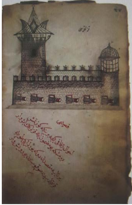
Resim 2. 18. yüzyıl başında derlenmiş Mecmuada, Kız Kulesi, (Ali Nihat Tarlan Yazmaları, t.y)

İstanbul'un fethine şahit olan tarihçi Tursun Bey'in naklettiğine göre, kule Fatih Sultan Mehmet tarafından boğazı koruma amacıyla İstanbul'un fethinden sonra yeniden inşa ettirilmiştir. Tursun Bey; "... ve İstanbul liman ağzına mukâbil, Anadolu yakasında, deniz içinde döküncü taş arasında bir muhkem kal'a yaptırdı, ve toplar vaz' eyledi ki, atıldukça liman içinde gemi turgurmaz" diyerek İstanbul limanındaki güvenliğin kule ile pekiştirildiğini belirtmektedir. Nitekim boğazı korumak ve gözetim altına tutmak amacıyla yapılmış olduğu, binanın ve mazgal deliklerinin konumundan da anlaşılmaktadır. Kulenin giriş kapısı Üsküdar'a bakmakta, kuzey, güney ve batı tarafında toplam yedi adet top mazgal bulunmaktadır. Kuzey ve batıdaki altı tanesi duvarlara 90 derece, güneydeki bir tanesi ise daha eğik bir açı ile inşa edilmiştir (Resim 3), (Türkhan, 2008, s 653). Evliya Çelebi, Seyahatnamesinde Kız Kulesi'ni;