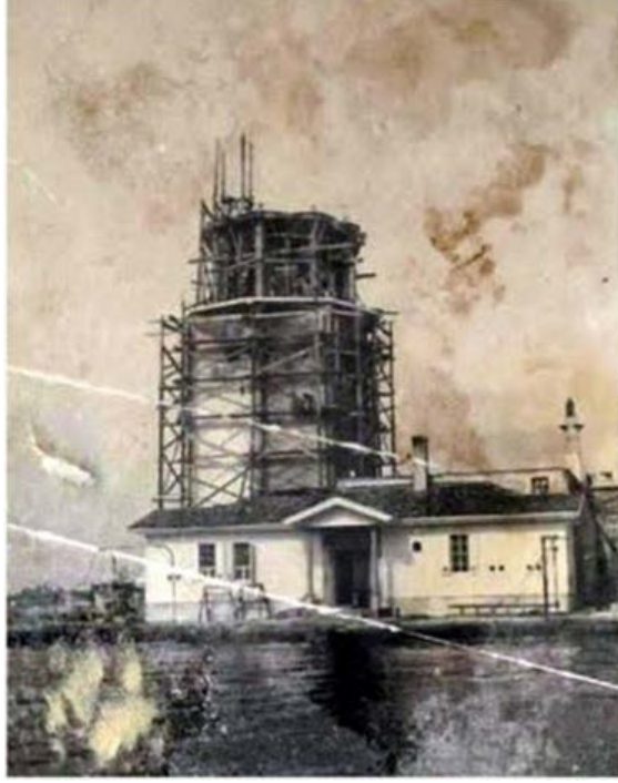
Resim 4: Kız Kulesi ve Restorasyon.