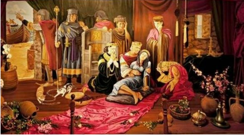
Resim 9. İmparatorun Kızı ve Yılan. (Konuloji, 2017).

İmparatorun Kızı ve Yılan: Bizans imparatoru kızını yetiştirmeleri için ülkenin en bilge insanlarını görevlendirmiştir. Bu bilginlerden bir tanesi, kızının 18 yaşına geldiğinde bir yılan tarafından sokulacağını söylemiştir. Kral bu bilgiden etkilenerek Kız Kulesi'ni düzenletip, kızını orada korumaya çalışmıştır. Tüm önlemlere rağmen 18 yaşına basan imparatorun kızı, hediye olarak gönderilmiş olan üzümün içinden çıkan yılan tarafından sokularak zehirlenir. İmparator bu durumda kaderden kaçılmayacağını anlamıştır. Fakat kızının toprakta yılanlar tarafından yenileceğini de düşünerek, bedenini mumyalatır ve pirinç tabuta koydurarak Aya-sofya'nın yüksek duvarlarından bir tanesine yerleştirmiştir (Resim 9), (Menekay, 2009, s.3).